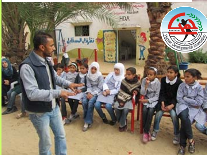
Le collectif Solidarité Al Qarara finance les actions de l'association pour le développement humain.